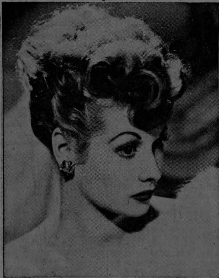
Afirma Max Factor Jr. que la verdadera atracción femenina sólo puede conseguirse con un absoluto cuidado en todos los detalles, como sabe bien la adorable estrella LUCILLE BALL.

haber presentado una lista completa de todas las faltas que deben evitarse si se quiere tener una perfecta apariencia personal. Las que quedan mencionadas son las que vinieron a su mente por ser de las que con más frecuencia se observan.