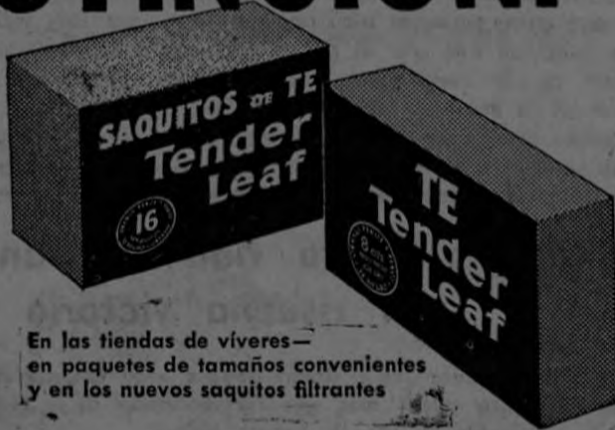
En las tiendas de viveros— en paquetes de tamaños convenientes y en los nuevos saquitos filtrantes